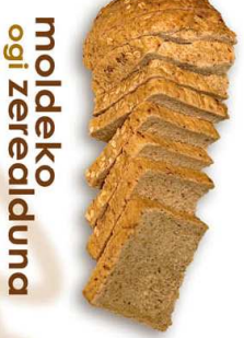
moldeko ogei zerealduna