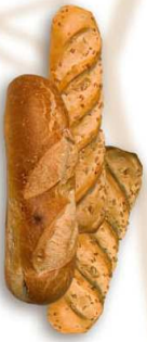
fruitu lehorrezko ogia