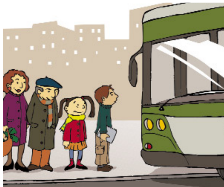
Hizkuntzarekiko eta erabilerarekiko jakinmina duena ez da galduta ibiliko. Nora jo badaki, eskualdeko udal euskara zerbitzuetara edota buruntzaldea.org webgunera.

Familia eta eskola, haurrak eta aisialdia..., hizkuntza eta erabilera etxetik bertatik garatzen hasi behar dira. Hizkuntza ohiturak etxean bertan hasten direlako. Kanpainaren esaldi nagusiak dioen bezala, haurrek "zer entzun, hura esan". Zorionez, hizkuntzarekiko eta erabilerarekiko jakinmina duena ez da galduta ibiliko. Nora jo badaki, eskualdeko udal euskara zerbitzuetara edota buruntzaldea.org webgunera.