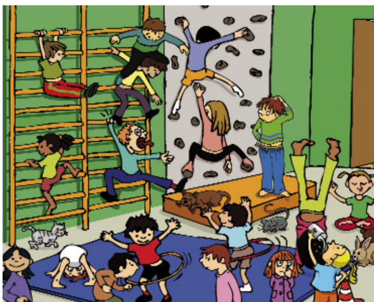
Eskola osagarri bat da, garrantzia handikoa, baina eskolak ezin du familia ordezkatu.

Denbora gutxi da buruntzaldea.org webgunea berrituta aurkeztu dutela. Bada, atari nagusian ezker aldean dagoen "Zuretzat" estekan klik eginez gero "Gurasoak" izeneko az-